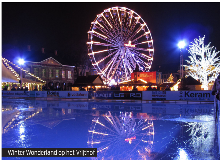
Winter Wonderland op het Vrijthof