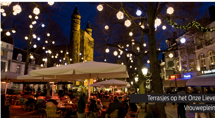
Terrasjes op het Onze Lieve Vrouweplein