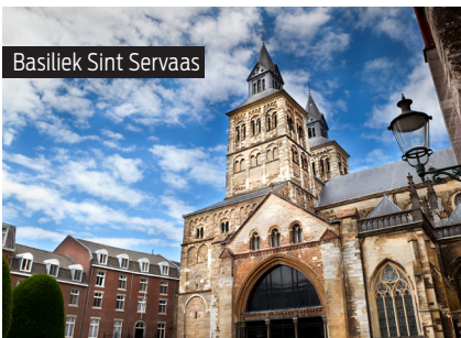
Basiliek Sint Servaas