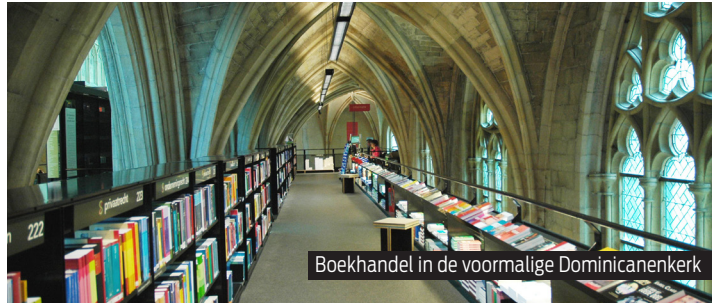
Boekhandel in de voormalige Dominicanenkerk

Meer bijzondere winkelstraatjes en adressen vind je met de Mooi Maastricht Route, die je gratis kunt downloaden op www.vvmaastricht.nl .